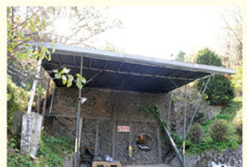
▲ 화약저장고 (2000년대)

현재 옹기테마공원은 누구나 참여할 수 있는 다양한 체험프로그램을 운영하고 있으며 배요섭 옹기장(前 서울시 무형문화재 제30호, 現 명예보유자)의 자문을 받아 옹기 가마를 복원해 전통문화를 알리고 있습니다.