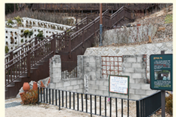
▲ 현재 모습 (흔적의 터)